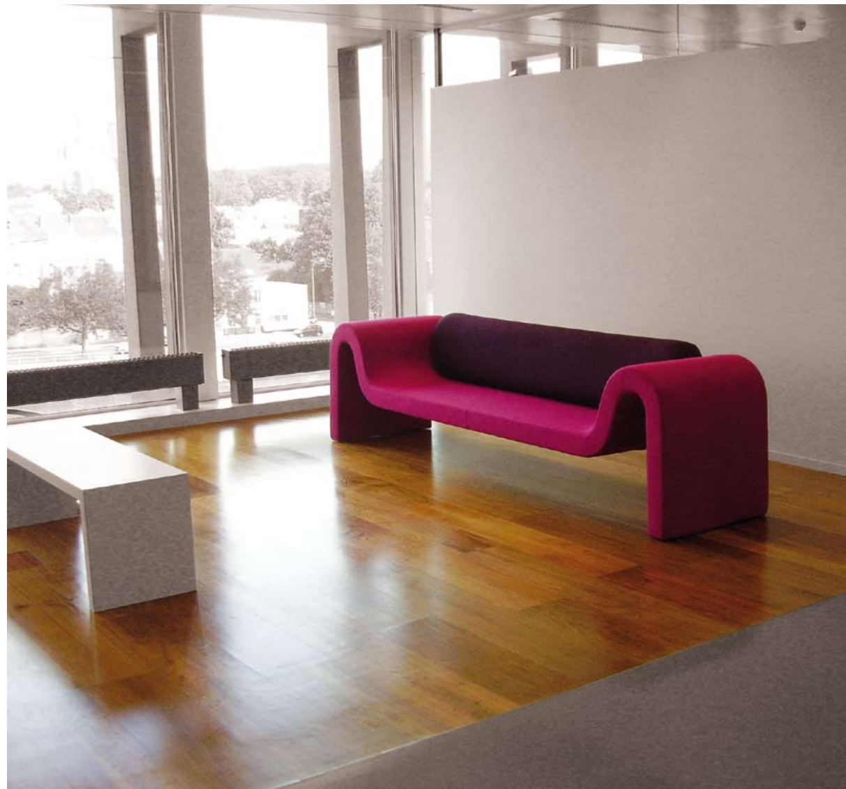
Détail du petit espace d'attente de la direction.