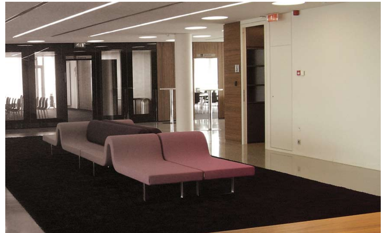
View of the long sofa to the multi- purpose meeting rooms.