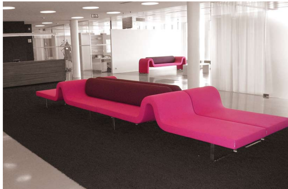
Vue du long siège et du petit espace d'attente.