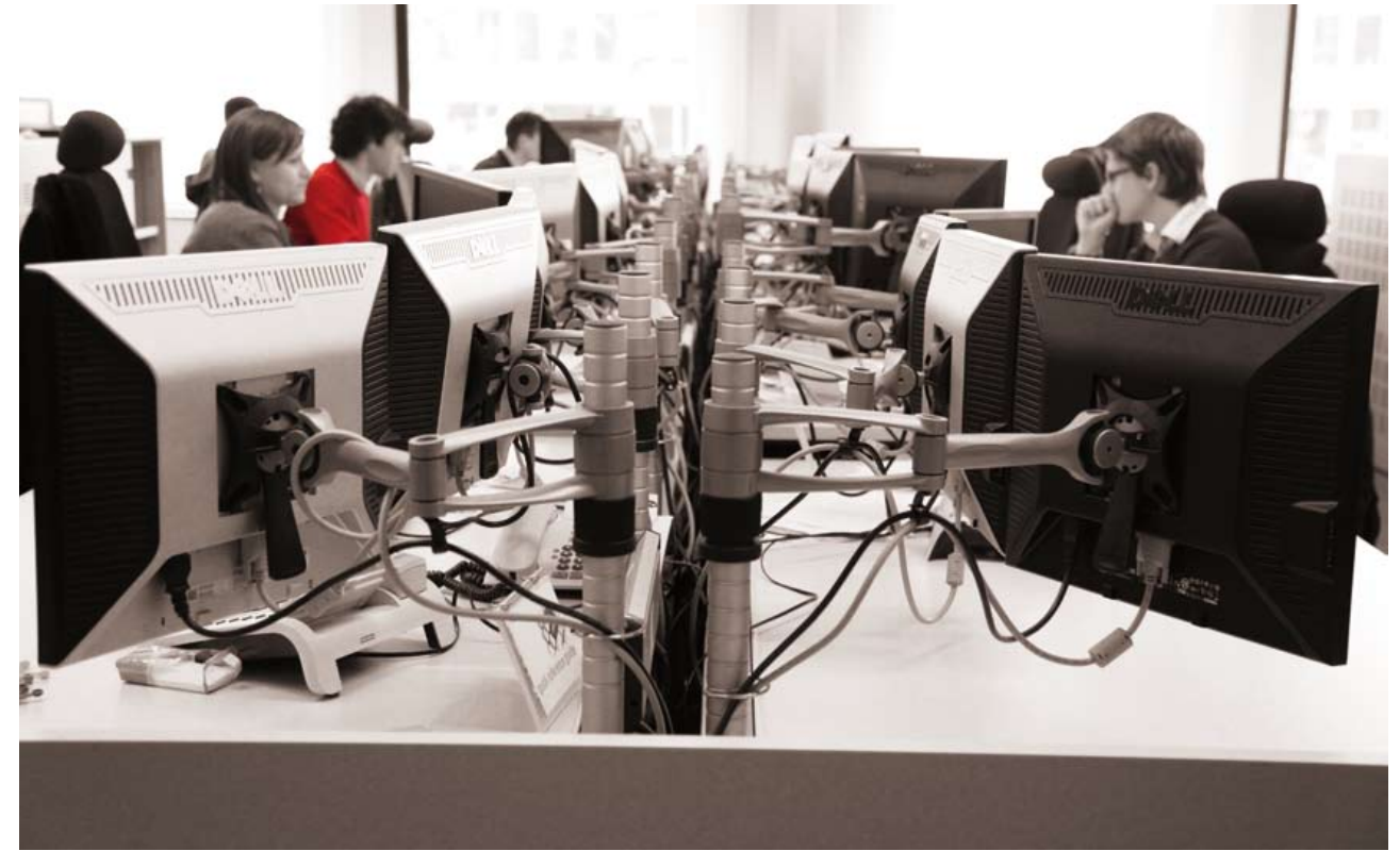
Traders desks. De- tail of the monitor stand.