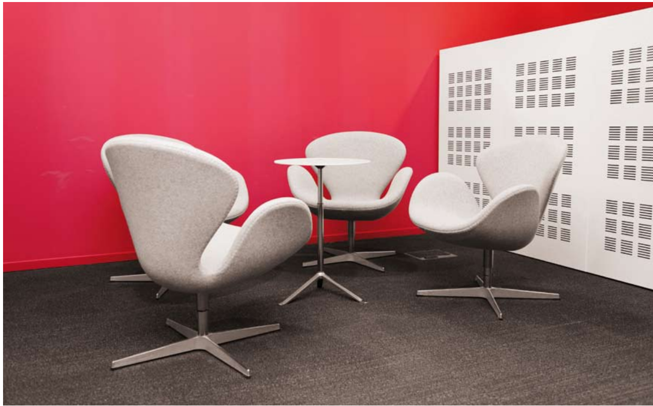
Espace de détente.